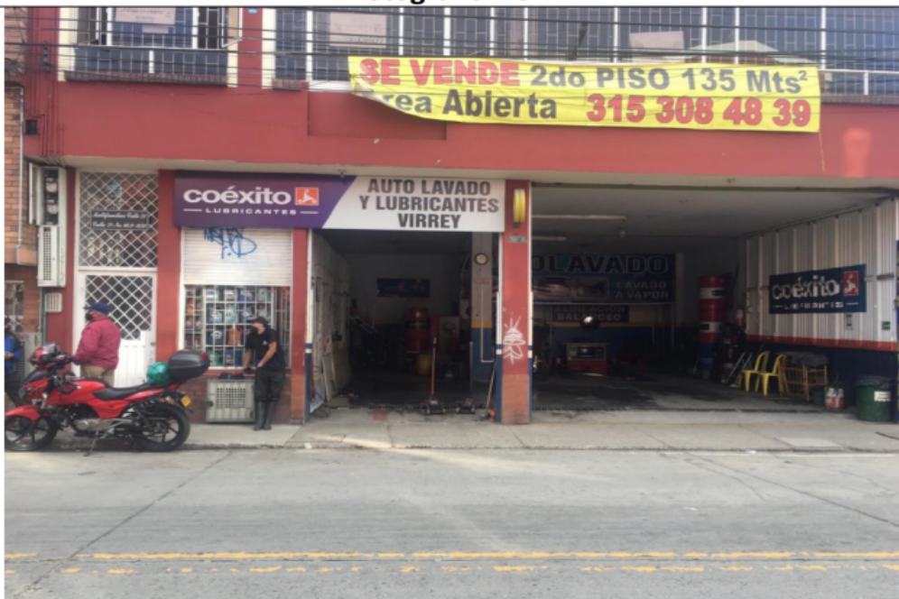
Foto panorámica del establecimiento

5. EVALUACIÓN TÉCNICA En la siguiente tabla se relacionan los hechos observados durante la visita técnica que evidencian el presunto incumplimiento frente a la normatividad vigente.